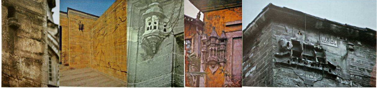
Fotoğraflar: Ayazma Camisi, Üsküdar, İstanbul / Anıtkabir, Ankara / Ayazma Camisi, Üsküdar, İstanbul / Darphane, İstanbul / Büyük Yeni Han, Çakmakçılar Yokuşu, İstanbul. (Cengiz Bektaş)